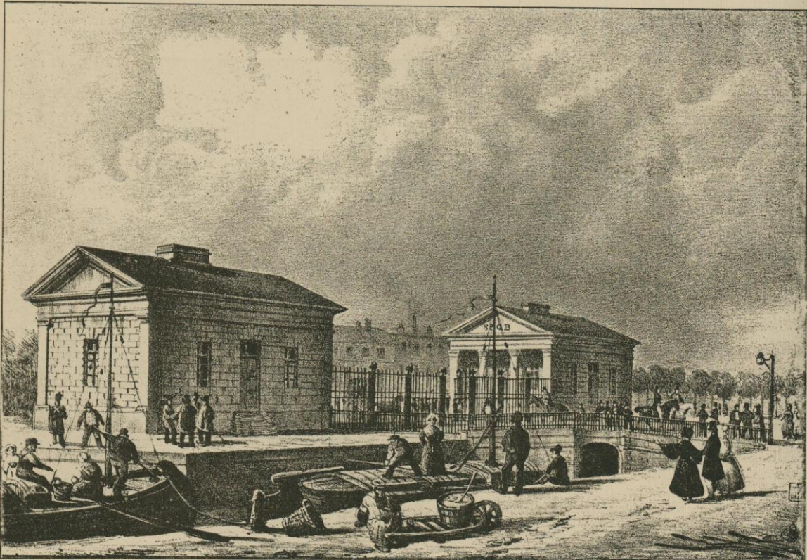
PORTE DE FLANDRE.

Cette partie des boulevards, destinée à devenir la plus animée et la plus brillante, était, vers 1840, plus solitaire que les boulevards inférieurs. Ceux-ci s'étaient rapidement bordés de magasins de charbons, de hangars et de halles. Les allées et venues des bateaux sur les canaux, le trop plein d'activité et de vie qui, des quartiers